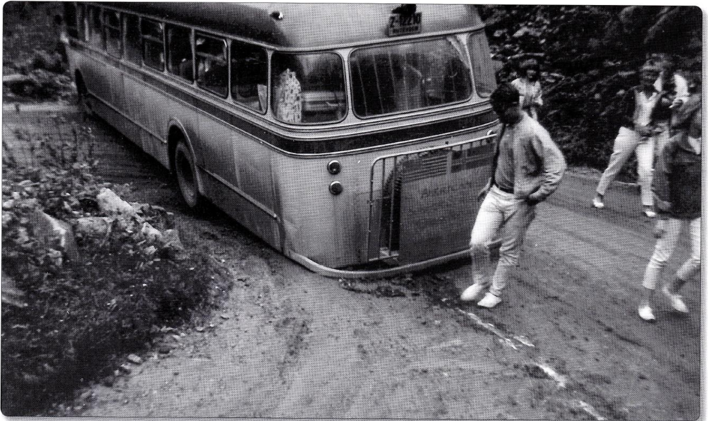
Z-12210 American Summer School ferie 1964. Mellom Vøringsfossen og Kinsarvik. Høyre forhjul på utsiden av veien.