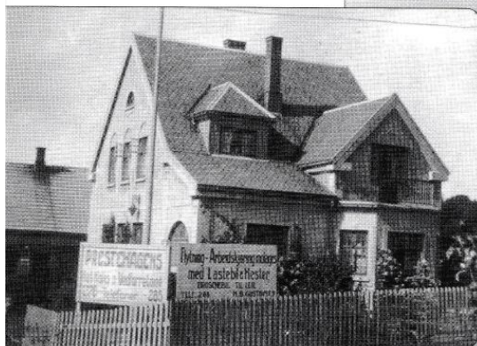
Huset i Gokstadveien nr. 4. Garasjene i bakgrunnen. Legg merke til reklameplakater på stakittgjerde.